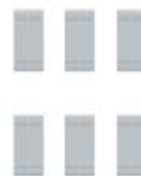
3 + 3 módulos