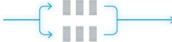
3 + 3 módulos