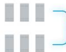
3 + 3 módulos