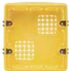
506E (106x117x52 mm)