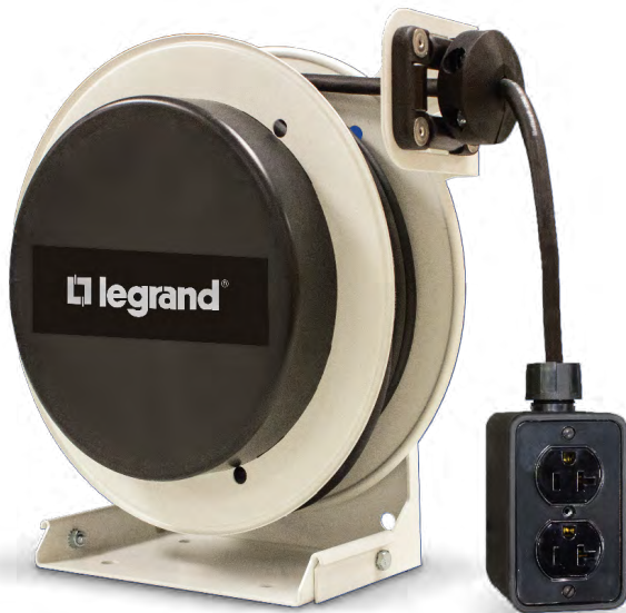
Riel de Cable Serie 1000