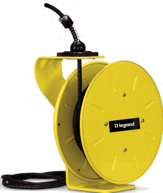
Cara Frontal del riel Serie 1200