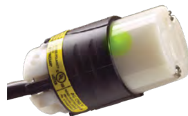
Monitor de continuidad de tierra