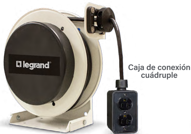
Cara Frontal del riel Serie 1000