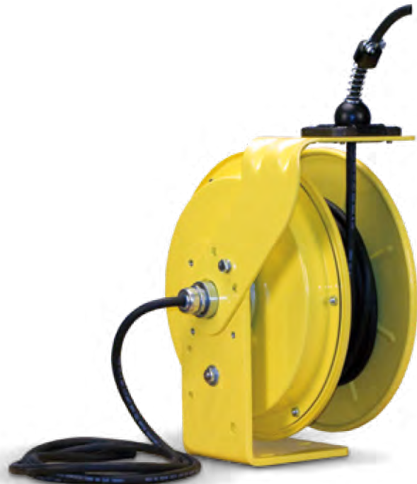
Cara Posterior del riel Serie 1200