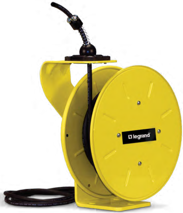
Riel de Cable Serie 1200