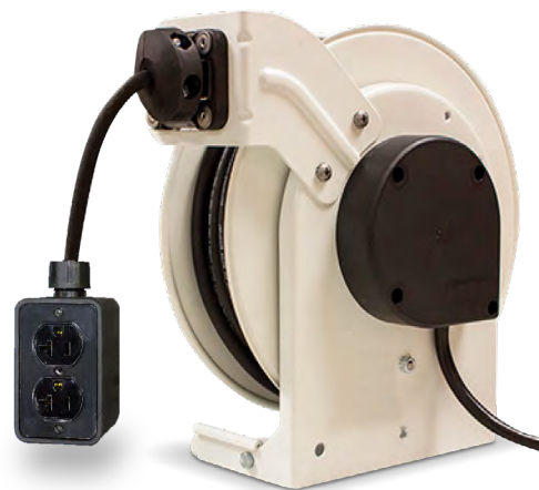
Cara Posterior del riel Serie 1000